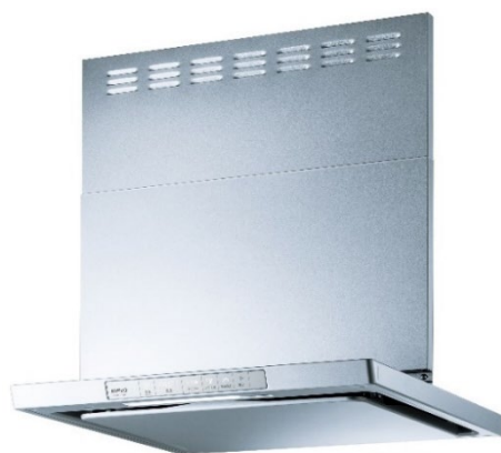
新 XGR シリーズ イメージ

AirPRO は、富士工業グループの一般家庭用レンジフードの単品取替ブランドです。FUJIOH は、富士工業グループの企業ブランドです。