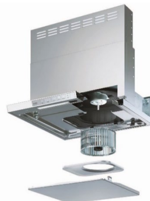
XGR シリーズ 展開図