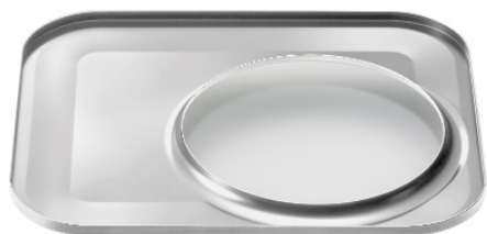
オイルトレイ イメージ