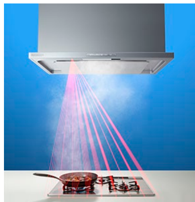
風量おまかせ運転 温度センサー照射イメージ 製品は OGR シリーズ